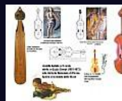
Collezione Maggi (83Kb)