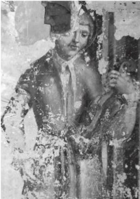
► Cremona: Chiesa di Santa Maria Maddalena. • Il Santo Genesio, affresco.

SAN GENESIO, ATTOR MIMO, MUSICISTA E MARTIRE NEL 303 DC. ASSUME IMPORTANZA NELLA STORIA DEL TEATRO E DELLA MUSICA TANTO DA ESSERNE CONSIDERATO PROTETTORE DALLA CHIESA ROMANA