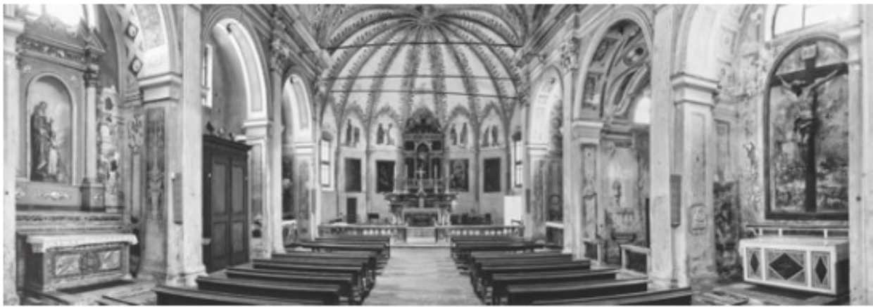
▲ Chiesa di Santa Maria Maddalena a Cremona.