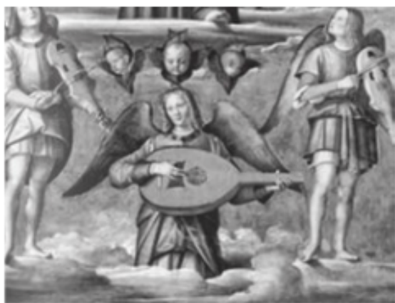
▲ Chiesa di Sant'Abbondio a Cremona, dipinto di Galeazzo Campi.

come Friedrich von Hausen, Ulrich von Gutenberg e Blioger von Steinach. Marco Girolamo Vida , può rappresentare la figura di letterato ed ecclesiastico (Cremona 1485 - Alba 1566) che incarna il desiderio di classicità all'interno di una cultura che si affina nel Rinascimento. Le sue opere sono un singolare connubio tra musica, teatro, letteratura classica e vanno da una singolare riscrittura di una Eneide cristiana ad un poemetto sul gioco degli scacchi, un altro sui banchi da seta, una poetica ferma al culto della latinità di fronte all'ellenismo ormai trionfante. Contemporaneo al Vida si può ricordare Agato , nobile cremonese appartenente alla famiglia degli Agazzi con diletto per la recitazione, che nei primi anni del 1500 recita l'egloga che così inizia « Sona, pastor, da poi ch'el ti diletta ».