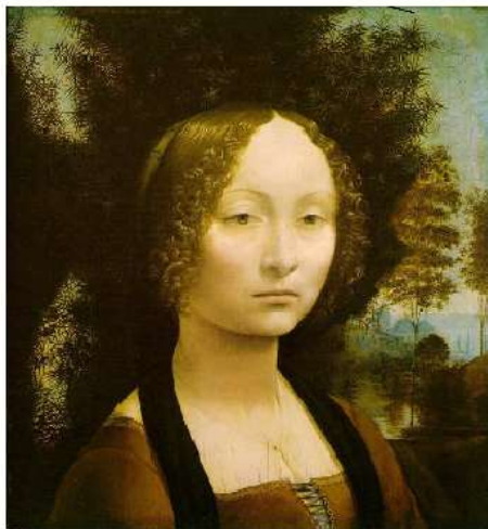
Il Ritratto di Ginevra de' Benci - Leonardo da Vinci, 1474 National Gallery of Art di Washington.

lago Benaco, ilqual chiamano volgarmente lago di Garda. .MATTHIOLI DA SIENA; MDLII