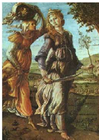
Il Ritorno di Giuditta a Betulia - Sandro Botticelli, 1472 Galleria degli Uffizi a Firenze