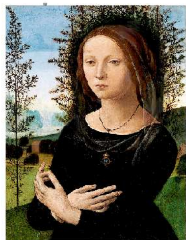
La donna del ginepro, - Lorenzo di Credi, c 1478 Metropolitan Museum of Art, New York