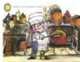
La Cucina di Cremona e nel Cremonese presentato da: Comune di Salò Museo Torriani